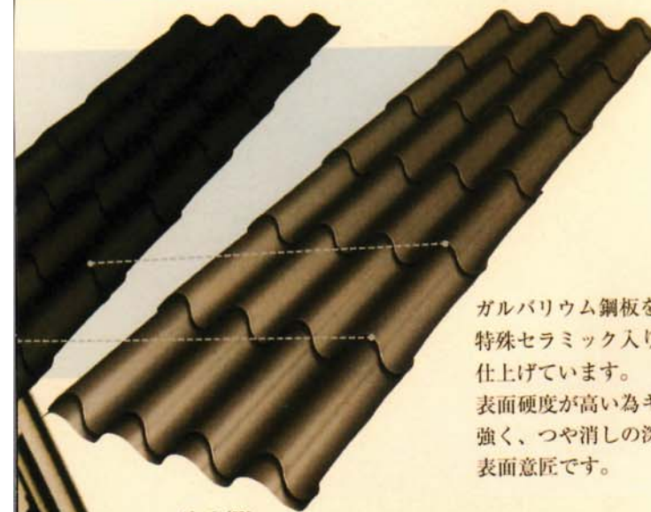
ピッチ/350mm カラー/銀黒 (GE8)

350~2100mm(定尺)をはじめ、最大約8000mmまでの連続プレスが可能。ツナギ目がない為、雨仕舞に優れています。