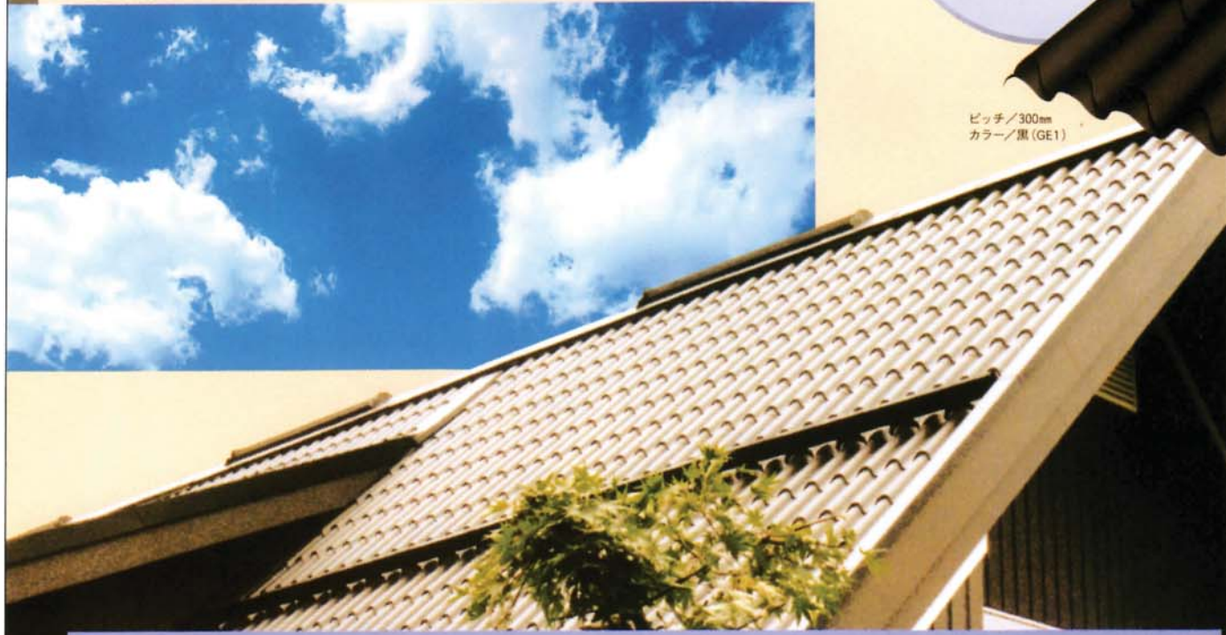
ピッチ/300mm カラー/黒 (GE1)