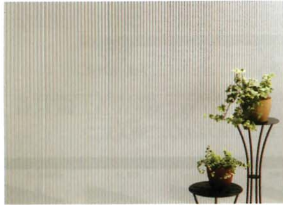
メタリックシルバー