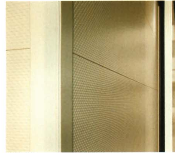
アイボリーホワイト

細やかな菱形エンボスでシャープな印象に。 シンプルで雰囲気ある建物を演出します。